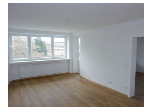
Helle Wohnräume mit erweitertem Durchgangsmaß der Innentüren

Alle Baumaßnahmen wurden unter den Bestimmungen für die Förderbausteine der KfW „Altersgerechte Umbauten“ durchgeführt und eingehalten.