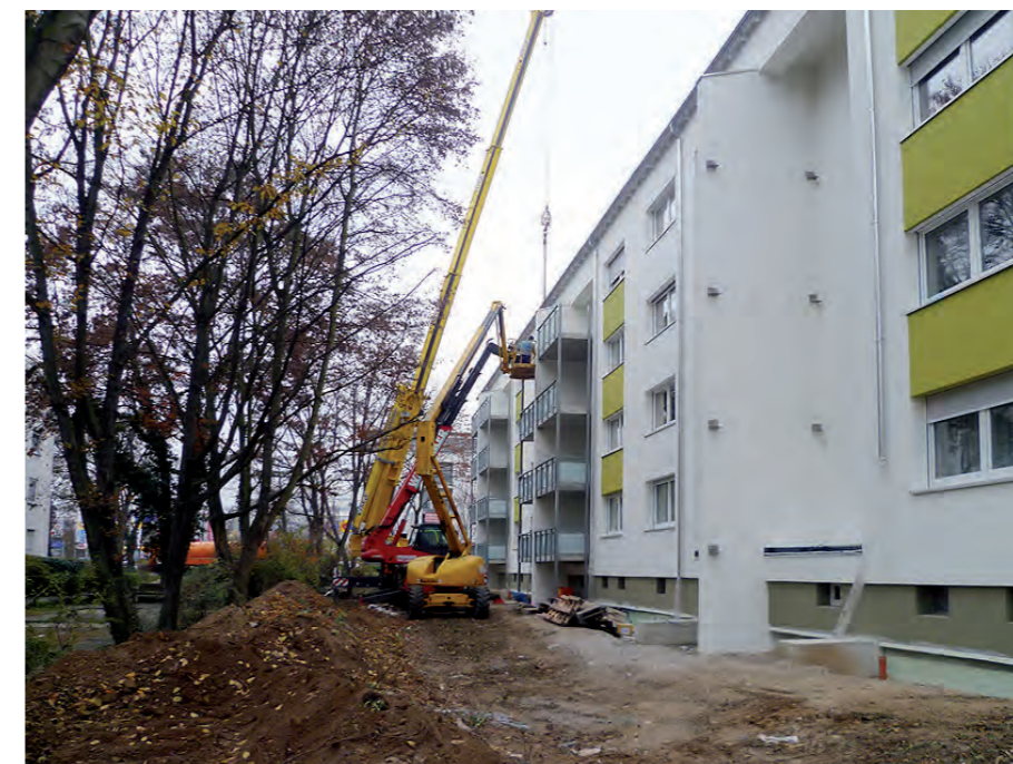
Ansicht der neu sanierten und energieeffizienten Gebäudehülle in der Röntgenstraße 34-40

Alles neu macht der Mai. Zumindest in Wiesbaden in der Röntgenstraße 34-40. Dort haben im Mai dieses Jahres umfangreiche Sanierungsarbeiten begonnen. Insgesamt neun Monate sollen sie dauern. Die 1967 errichteten vier Gebäude mit 32 Wohneinheiten wurden von Grund auf energieeffizient modernisiert und attraktiver gestaltet. Noch in diesem Jahr sollen die Arbeiten komplett abgeschlossen werden.