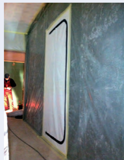
Folienschutz in den Wohnungen