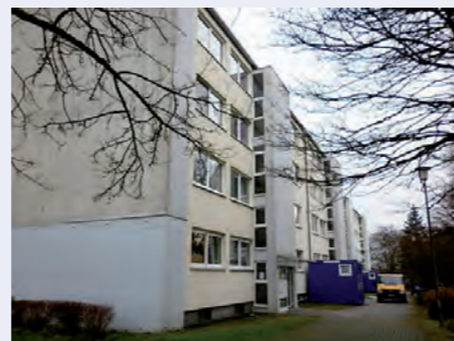
Sanitärcontainer vor dem Objekt Rosfeld 58-64

Der Zeitraum der Beeinträchtigung der Mieter durch die komplexe Strang- und anschließende Badsanierung betrug in Aachen pro Strang ca. 14 Tage.