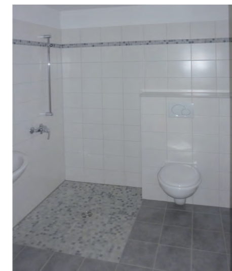
Ebenerdige Dusche im Suttnerweg

Alle Baumaßnahmen wurden unter den Bestimmungen für die Förderbausteine der KfW „Altersgerechte Umbauten“ durchgeführt und eingehalten.