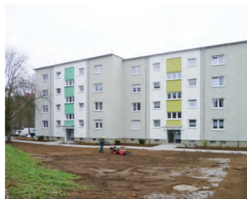
Letzte Arbeiten an den Außenanlagen