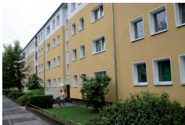
Fassadengestaltung mit StoTherm Vario in der Linsingenstr. 23-29 in Hannover

Farb- und Materialpläne werden für uns mit Unterstützung des Sto-Designstudios erarbeitet, in dem erfahrene Fachleute ihr technisches und ästhetisches Wissen einbringen.