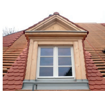
fertige Mustergaube, 01/2020