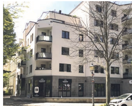
Fertigstellung Bauprojekt MD, Danzstraße