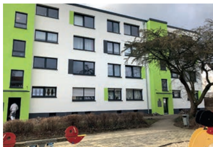
Am Kreuzacker, 11/2019

Pünktlich nach nur 6-monatiger Bauzeit konnten wir Ende November 2019 unserem Auftraggeber, der VBW Bauen und Wohnen GmbH, die drei 4-geschossigen Wohnhäuser mit insgesamt 48 Wohneinheiten energetisch saniert übergeben. Unter bewohnten Bedingungen wurden die Fassade mit einem mineralischen WDV-System gedämmt,