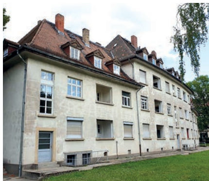
Gesamtansicht vor Sanierung, 10/2019

haustechnischen Anlagen werden komplett neu installiert, die Bäder vergrößert, Fenster und Türen ausgetauscht, das Dach neu eingedeckt, die Fassade überarbeitet und es erfolgt aufgrund des Denkmalschutzes eine innenliegende Wärmedämmung. Ab 01.09.2020 wird die Wohnbau Mainz diese attraktiven Wohnungen im modernen Standard wieder vermieten können.