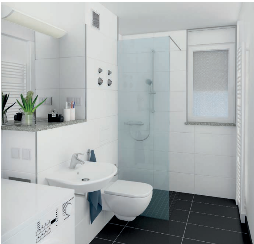
Visualisierung des Duschbades für ein BV in Rüsselsheim

Die MACON BAU GmbH Magdeburg hat sich in der Planung weiterentwickelt.