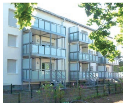
neue Balkonanlagen, 05/2020

Bei dieser Komplettanierung wurden die gesamten haustechnischen Anlagen (HLSE) erneuert, die Bäder vergrößert und neu gestaltet, asbesthaltige Bauteile und Baustoffe nach TRGS 519 ausgebaut und entsorgt, sämtliche Fenster, Hauseingänge und Wohnungseingangstüren erneuert, die Fassaden mit einem WDV-System, die Dachböden mit einem begehbaren Dämmsystem und die Kellerdecken mit einem mineralischen System gedämmt. Die alten Balkone wurden durch