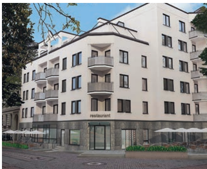
Visualisierung MD, Danzstraße

Gerne präsentieren wir mit visualisierten 3D-Darstellungen die Baumaßnahme auf Mieterversammlungen, um die Vorstellungskraft der skeptischen Mieter zu unterstützen. Die detaillierten Visualisierungen sind aber auch für den Handwerker eine willkommene Hilfe bei der Ausführung der geplanten Leistungen.