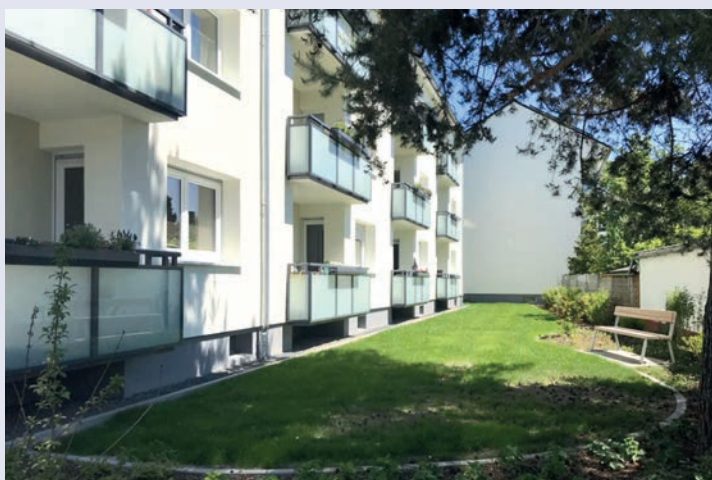
Haus 22-24, Loggien mit neuer Außenanlage