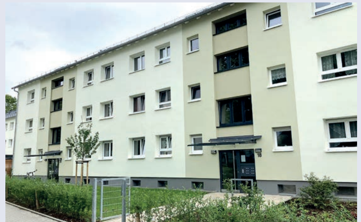
Haus 18-20 nach der Sanierung