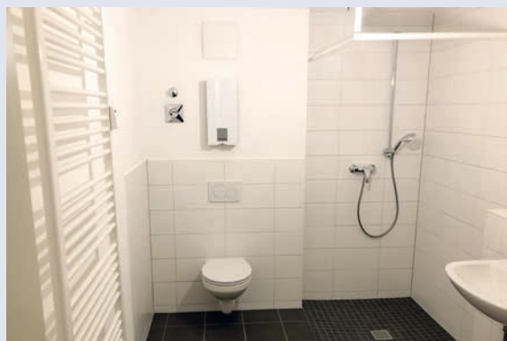
vergrößertes Bad mit bodengleicher Dusche