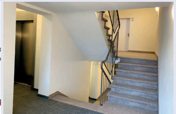
Treppenhause im EG mit Terrazzoboden und Aufzug