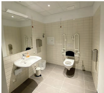
Behinderten-WC, Foto: 31.03.2022