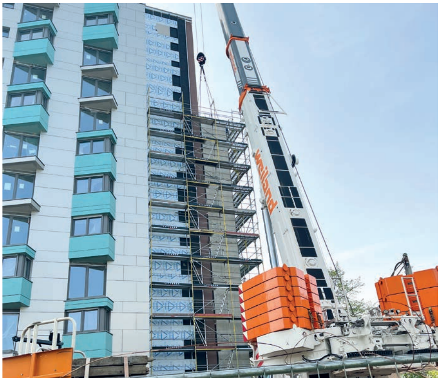
Errichtung des Aufzugschachtes, Foto 04.2022

Im Mai 2021 begannen wir mit der Komplettsanierung eines Hochhauses der GBG-Mannheimer Wohnungsbaugesellschaft mbH. Die Komplettsanierung umfasst im Wesentlichen die komplette Gebäudehülle mit Fassade, Fenstern und Balkonen, dem Anbau eines zweiten Aufzugschachtes für einen Feuerwehraufzug und die Erneuerung des vorhandenen Aufzuges. Darüber hinaus erfolgt eine komplette Innensanierung mit neuen Wohnungstrennwänden sowie der Erneuerung der kompletten haustechnischen Anlagen (HLSE). Das Gebäude steht am Eingang zur Bundesgartenschau 2023 und wird durch seine schön gestaltete Alucobond-Fassade Beachtung finden.