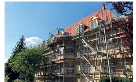
Schneckenburgerstr. 2-6, Foto: 05.05.2022

Seit November 2021 sanieren wir für die Wohnbau Mainz GmbH ein weiteres denkmalgeschütztes Gebäude in der Schneckenburgerstraße. Bei der sehr anspruchsvollen Komplettsanierung kommt uns die Erfahrung aus dem 1. Bauabschnitt in der Schneckenburgerstr. 1, 3 und 5 zugute.