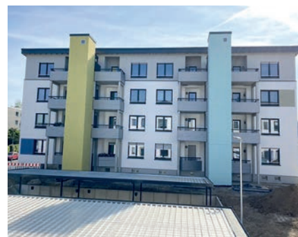
Feldgartenweg 13+15, Foto 05.2022

lagen und mit zwei vorgestellten Aufzugsanlagen ausgestattet. Alle Gebäude werden nunmehr mit einer modernen zentralen Gaskesselanlage in Kombination mit einer Luftwärmepumpe beheizt. Abschließend haben wir zwischen den Gebäuden eine Carportanlage mit elektrischen Ladestationen errichtet.