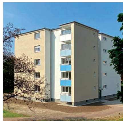
Rastenburger Str. 22 nach der Sanierung

Wohnungen mit großzügigen und barrierefreien Bädern ausgestattet und komplett hochwertig renoviert. Alle vier Gebäude erhielten eine innenliegende Aufzugsanlage mit insgesamt sieben Haltestellen, so dass jede Gebäudeebene angefahren wird. Der Wohnraumverlust ist dabei sehr gering.