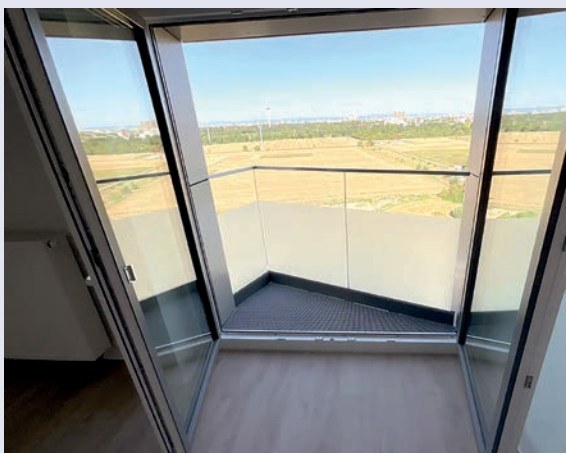
Freitritt mit Blick zur BUGA 2023

Das von uns sanierte Wohnhochhaus wird direkt am Eingang zur Gartenschau zu bestaunen sein.