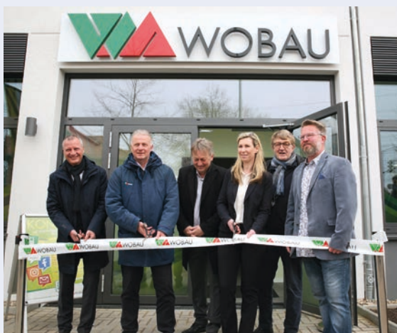
Eröffnung des Servicebüros-Süd der WOBAU