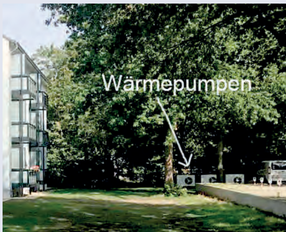
Wärmepumpen hier auf Fundament am Parkplatz