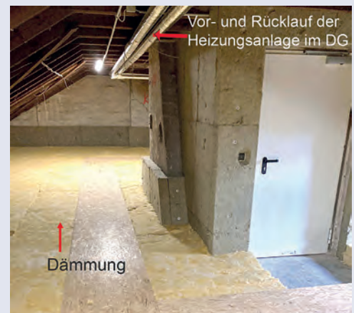
Heizungsverteilsystem jetzt im DG